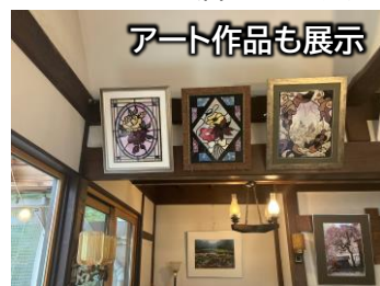
アート作品も展示