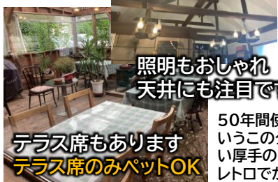
テラス席もあります テラス席のみペットOK

カフェ・レストランたかのは 福島県安達郡大玉村大山荒地4 0243-48-3800