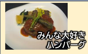
みんな大好きハンバーグ

定番のデミグラスソースハンバーグはもちろんですが、写真の「メキシカンハンバーグ」も人気!!スパイシーなトマトソースでリピートされるお客さまが多いそうです。