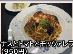
ナスとトマトとモッツアレラ(950円)