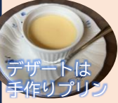
デザートは手作りプリン

店名が入った「たかのは風パスタ」は長年愛される人気メニューです。熱々の鉄板に卵とパスタがのっている、オリジナルティ溢れる逸品です。