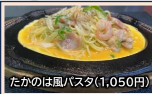
たかのは風パスタ(1,050円)

内容はその日によって変わります。パンも店内で焼いています。ドリンク・デザートつきで、1,100円。(ランチ11:00~14:30)