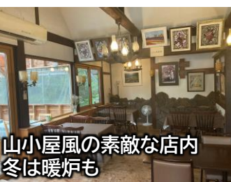
山小屋風の素敵な店内 冬は暖炉も